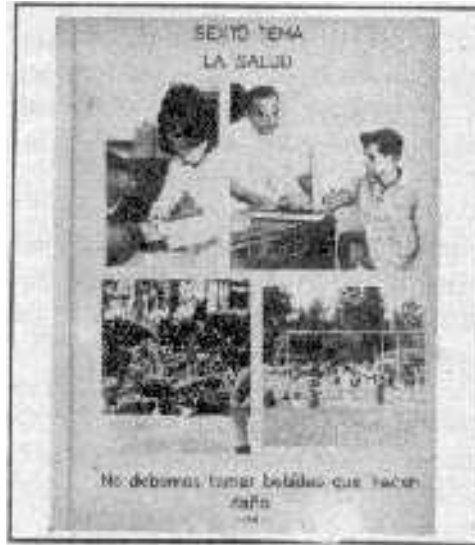
Página interior de la Cartilla Ecuador

La UNESCO desde el primer momento estuvo encantada con este programa. Primero, porque yo estaba aquí sólo con permiso - no hay que olvidar que yo seguía siendo funcionario de la UNESCO. Y la UNESCO estaba encantada de que un funcionario suyo fuera Ministro y aplicara todas las ideas que se habían discutido en su interior, en seminarios, en conferencias, etc., y que además se habían comenzado a aplicar en varios países del Tercer Mundo.