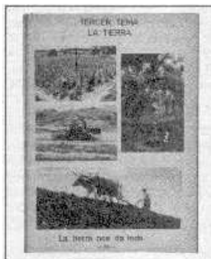
Página Interior de la Cartilla Ecuador

Había visto como España, que no tenía ninguna revolución, porque era la época de Franco, había introducido un programa de alfabetización, empleando a los profesores. Había visto y oído como en Yugoslavia se dio una campaña de alfabetización que se había convertido en una especie de movimiento político de masas, en donde los profesores tenían una mínima participación, y eran más bien obreros, ciudadanos, normales y corrientes los alfabetizadores, con un poco de ayuda de los estudiantes secundarios. Y había comenzado a oír - porque fue el año 61 - como en China, o en la India, las campañas se hacían en una forma más responsable