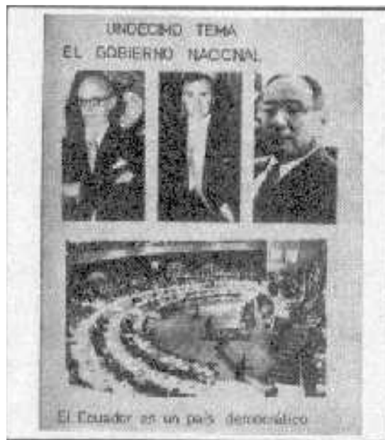
Página Interior de la Cartilla Ecuador