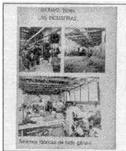
Página interior de la Cartilla Ecuador